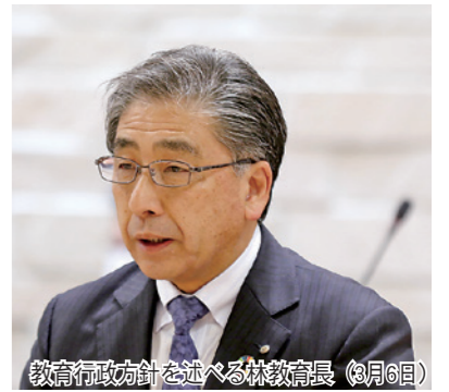
教育行政方針を述べる林教育長（3月6日）

3月町議会定例会で林剛敏教育長が「学びの中から豊かな心と健やかな体を育む生涯学習のまちづくり」に向けて述べた、令和2年度の教育行政方針の概要を紹介します。