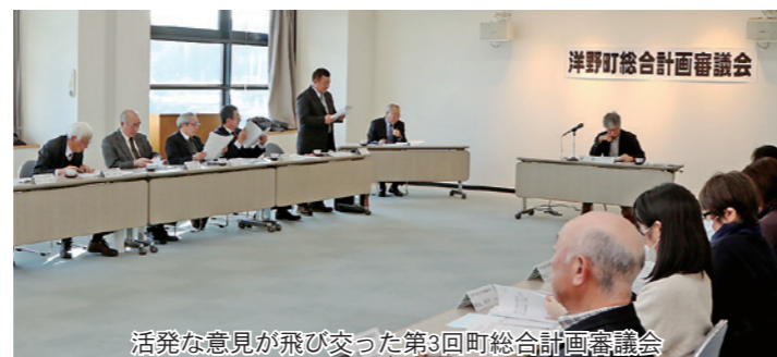
活発な意見が飛び交った第3回町総合計画審議会

町は、「第2期まち・ひと・しごと創生総合戦略」（以下、第2期総合戦略）を、2月28日付けで策定しました。第2期総合戦略は、少子高齢化などによる町の人口減少が避けられない状況の中、将来にわたる安心な暮らしや、町の魅力を引き出して関係人口の拡大を図る施策などについて取りまとめたもので、令和2～6年度までの5年間の計画です。今後、第2期総合戦略に揚げた取り組みを進め、事業の状況を毎年度検証しながら、目標達成に向けて取り組んでいきます。これまでの経過は、11月20日に開催した「第2回町総合計画審議会」で、町から第2期総合戦略の素案を提示し、町はその後、内容についての審議と併せて町民に意見公募（パブリックコメント）を実施し、寄せられた意見などを基に計画を調整。2月21日の「第3回町総合計画審議会」で第2期総合戦略の最終案が審議され、同日付けで戦略案を妥当と認める答申を受けました。